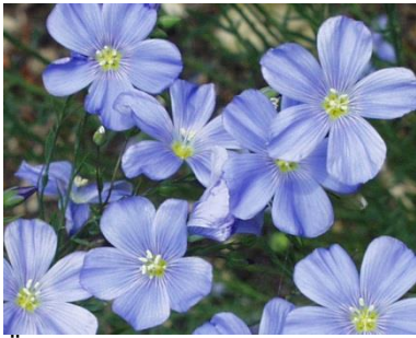
Österreichischer Lein ( Linum austriacum )