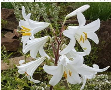
Lilium candidum im Kaukasus