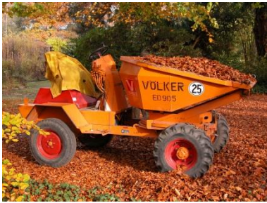
So viel Laub ist wertvoll!