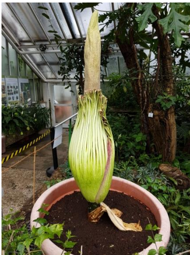
am 30.06.2017: 1,20 hoch