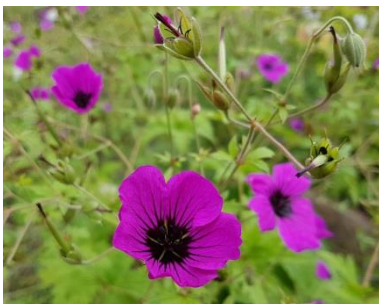
Geranium psilostemon im Kaukasus