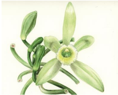
Vanille ( Vanilla planifolia )

Für welches pflanzliche Produkt hatte Mexiko bis zur Mitte des 19. Jahrhunderts das Monopol?